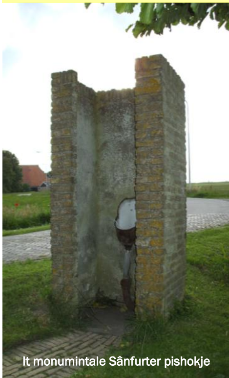
It monumintale Sânfurter pishokje

Simmerfamke fan Sânfurd, no't it hjerst wurdt, tink ik oan dy. Simmerfamke fan Sânfurd, no't it rûzich wurdt, nûnderje ik foar dy: Mankelietsjes, waarme wizen, komme út 'e dize fan 'e tiid. Simmerfamke fan Sânfurd, no't it hjerst wurdt, tink ik oan dy.